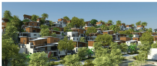
Résidence Les Roches Grises - St Quentin