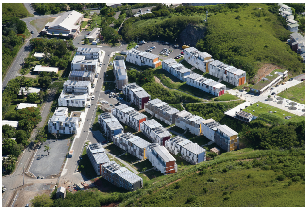
Résidence Universitaire de Nouvelle-Calédonie

“ Responsabilité, solidarité, exemplarité ”